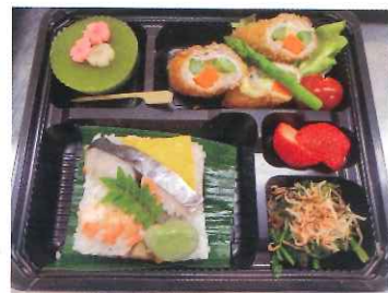
春の押し寿司御膳